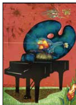
ARDY STRÜWER 2019