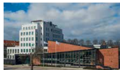
FRITIDEN HOTELL & KONGRESS

Lantlig miljö med innergård, restaurerat stall och varm gårdskänsla. Bistro.