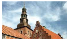
S:TA MARIA KYRKA

Hotellet vid sandstranden har inbjudit till rekreation och nöje sedan 1897. Ett av Sveriges mest prisbelönta spahotell.