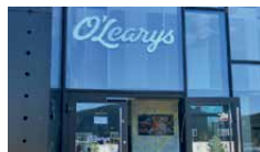
O'LEARYS I YSTAD

Elegant och historiskt hotell mitt i centrala Ystad med restaurang och bar.