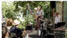
LILLA ÖSTERGATAN 3

Charlottenlund ligger cirka 8 km väster om Ystad. Slottet är byggt 1849 i medeltidsromantisk stil, med en öppen ljusgård med galleri.