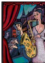
ANGELICA WIIK 2018