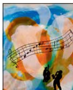
BIRGITTA GLENMARK 2024