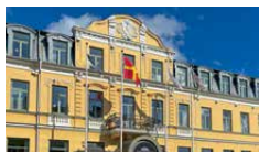
CONTINENTAL DU SUD

Klassisk kulturbyggnad i centrala Simrishamn med anrik atmosfär och servering i huset.